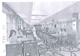
▲東京スカイツリーなどが 見える

組木を採用したのは、 木材のサイズがぴったり と合わなければ美しい模 様に仕上がらないことを 新たな夫婦となる新郎 新婦へのメッセージとし て込めたため。設計は フランドシヨップの店 舗内装・デザインを手 掛けた実績を持つTY PEA7が担当した。