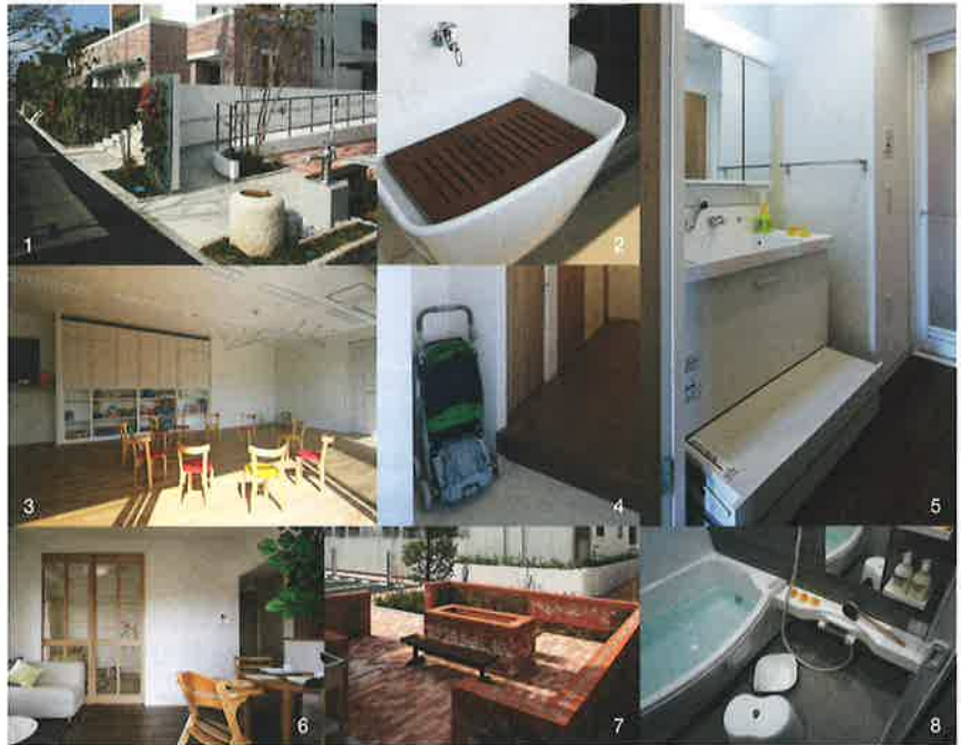
1.スロープ・防災井戸 アップ内蔵洗面化粧台 2.スロップシンク 3.子育てカフェ室内 4.ベビーカーの置ける玄関 5.子ども使いやすいステップ内蔵洗面化粧台 6.キッチンから子供部屋が見える空間 7.コミュニティスペース 8.親子で入れるワイド浴槽