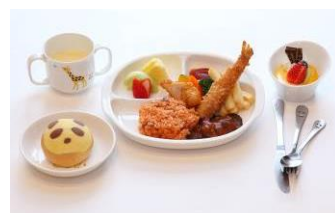
お子さまプレート