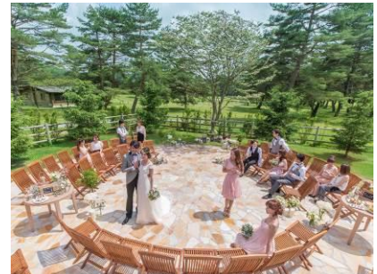
軽井沢 幸運の森ガーデン ルーチェ