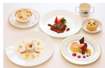
お子さまコース料理