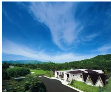
フォレスターナ軽井沢 全景