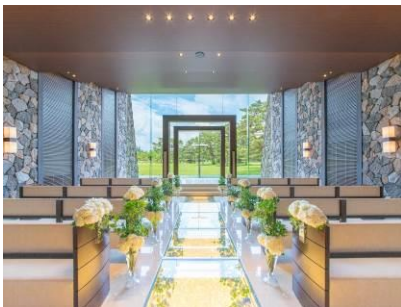
軽井沢 光のチャペル ピエールマティアード